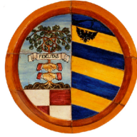
Provincia di Pesaro e Urbino